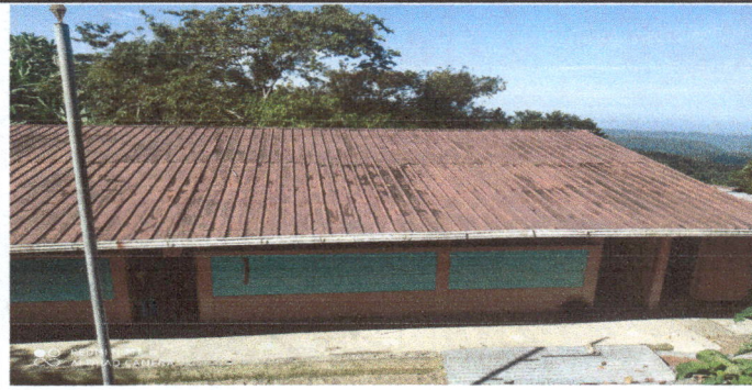
Foto1: Cambio de lamina único módulo.